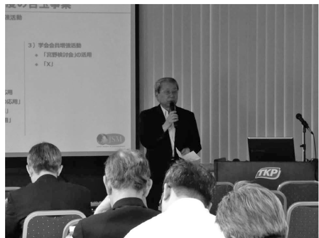
図1 宮理事長による挨拶